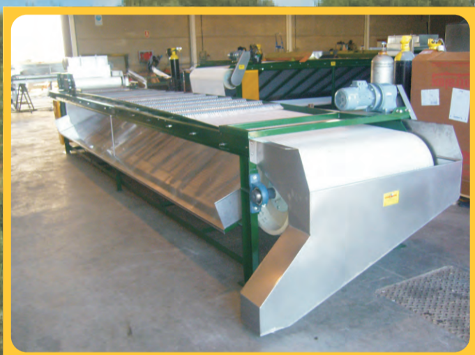
Perdigoneras Gauge/Calibrator Machine à retirer la petite olive