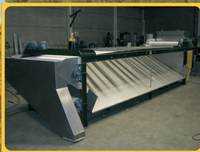
Perdigoneras Gauge/Calibrator Machine à retirer la petite olive