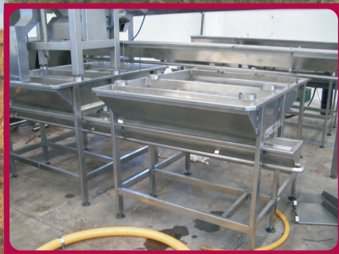
Bancadas para deshuesadoras Bench Banc