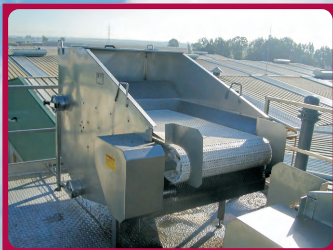
Filtro huesos Silo Filter Filtre