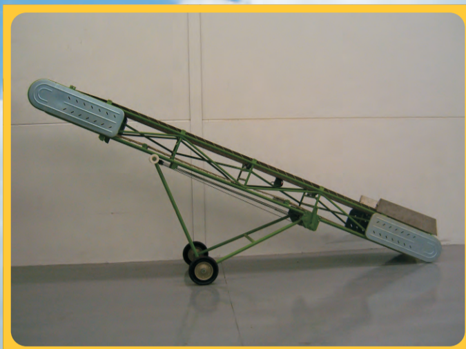
Elevador de banda 2 Elevator of band with profiles in "V" 2 Élevateur de bande avec profils 2