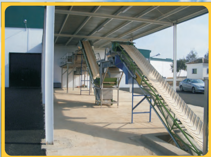
Elevador de banda Elevator of band with profiles in "V" Élevateur de bande avec profils