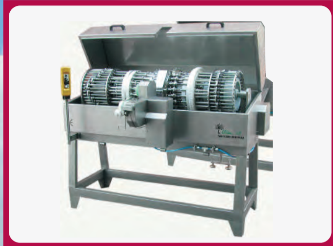
Rellenadora de Pimientos Paste Stuffing Pour farcir de pâte