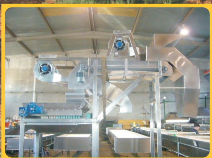
Limpiadoras Cleaner Nettoyants