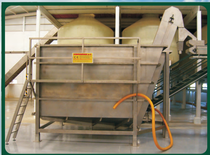
Tolvas 18.000 L Hopper Trémie