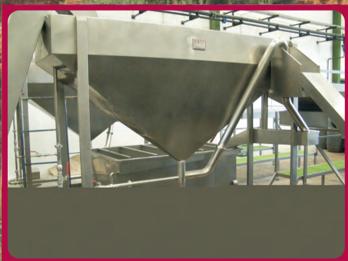
Densimetro Densimeter Densimètre