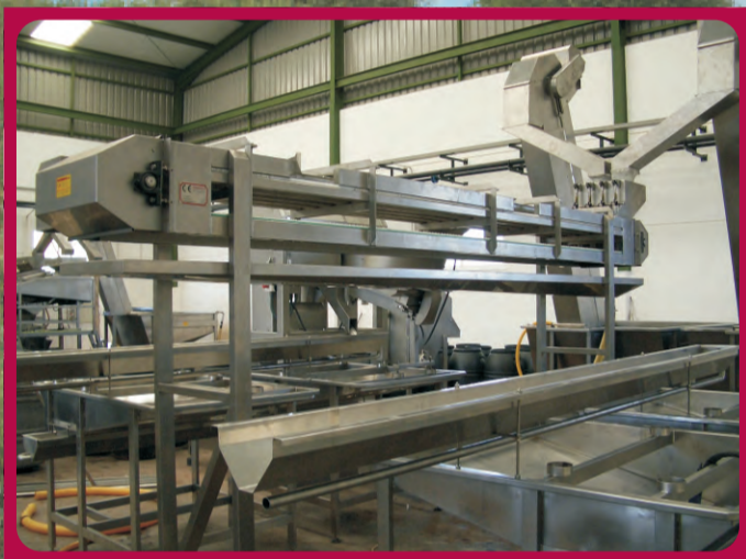
Cintas de Reparto Tape of distribution Ruban de distribution