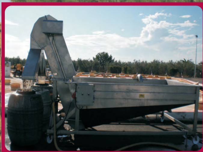
Tolva Inundada 3000 Flooded hopper 3000 Trémie inondée 3000