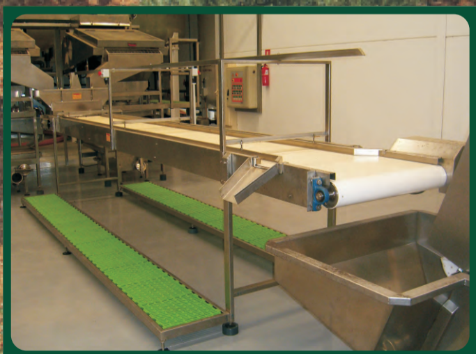
Cintas de Escogido Tape of chosen Ruban de choisi