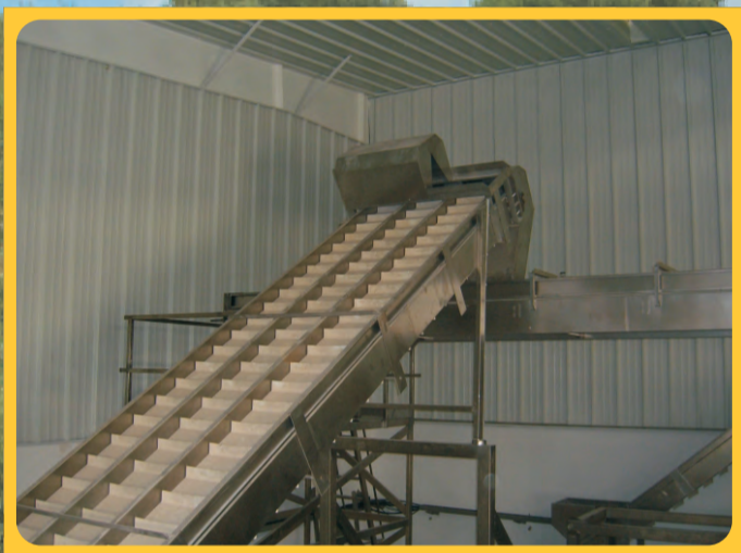
Elevadores de regletas Strip lifter Élevateur de réglettes