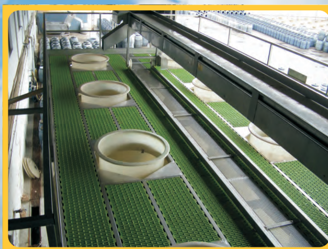
Plataformas Cocederos Platforms for deposits of boiling Plates-formes pour bassins de cuisson