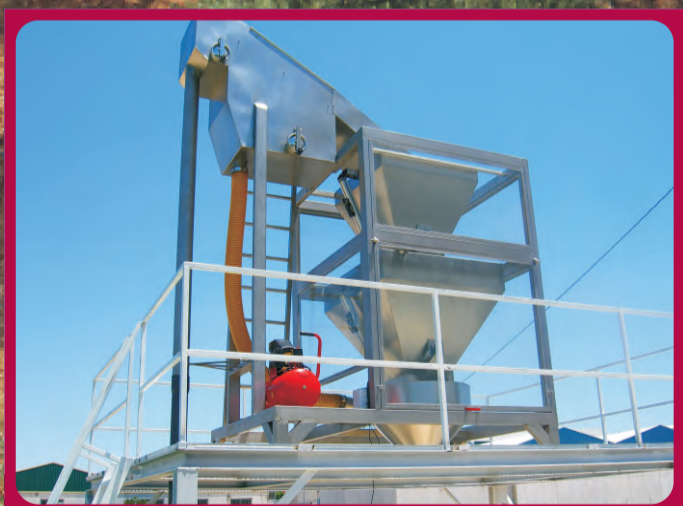
Pesadora con Filtro Weigher with filter Bascule avec un filtre