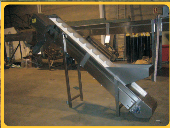
Elevador de regletas Strip lifter Élevateur de réglettes