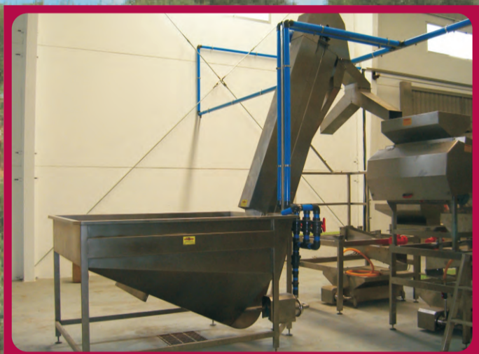
Tolva Inundada Flooded hopper Trémie inondée