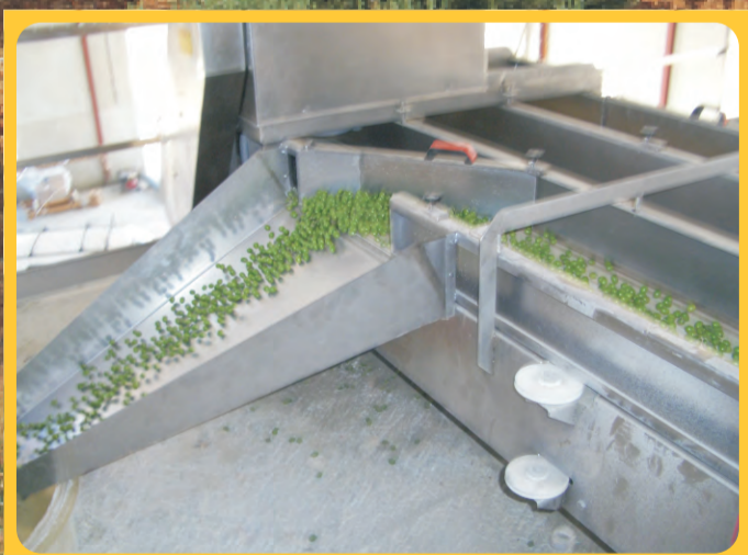
Cintas Transportadoras Conveyor Belt Ruban transporteuse