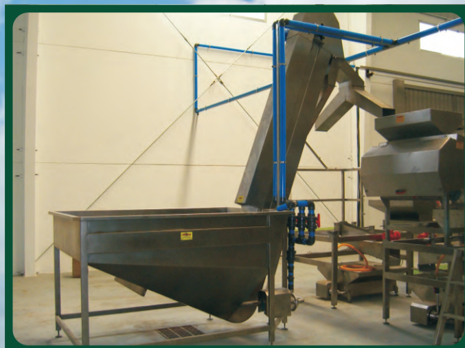
Tolvas Inundadas Flooded Hopper Trémie inondée