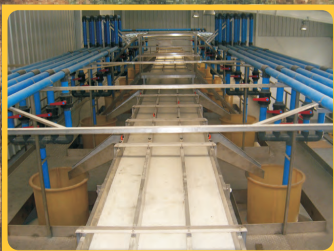
Cintas Transportadoras Conveyor Belt Ruban transporteuse