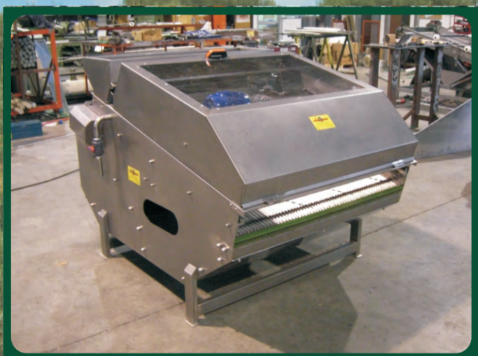
Desrrabadoras Destemmer Destemmer