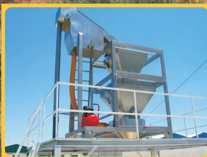
Pesadora en continuo Continuous weigher Bascule