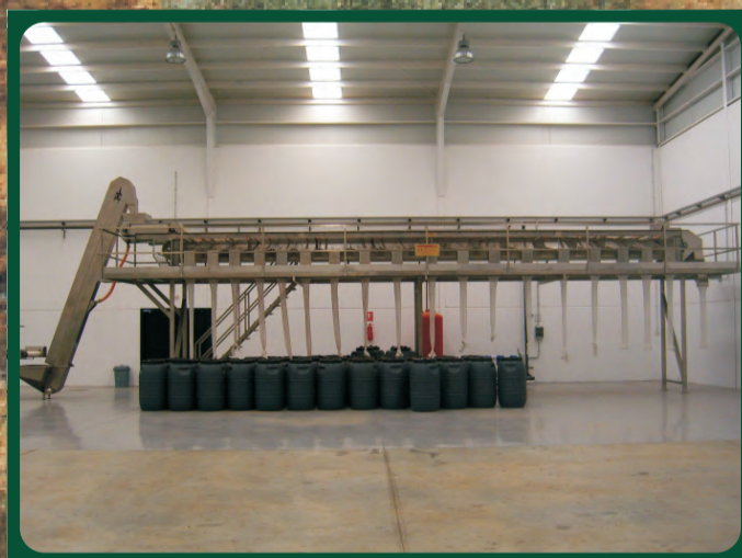
Clasificadoras Calibrator Trieur