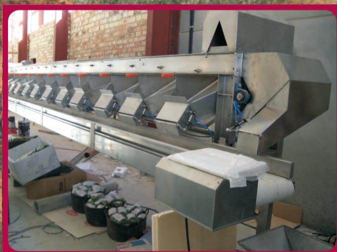
Máquina de Escandallo Machine for sampling Trieur/ Calibreur