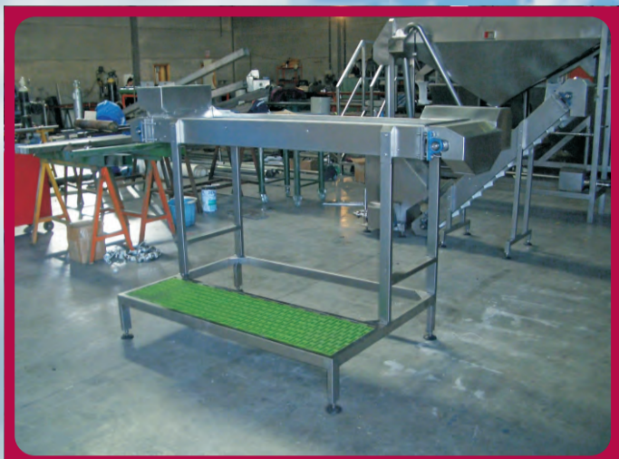
Cinta de Escogido Tape of chosen Ruban de choisi