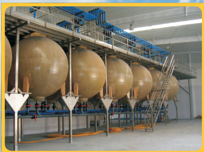
Plataformas Cocederos Platforms Plates-formes pour bassins de cuisson