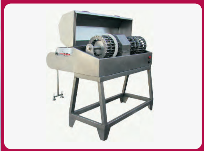
Deshueso - Rodajadoras Pitting - Slicing machines Dénoyauteuse - Trancheuse