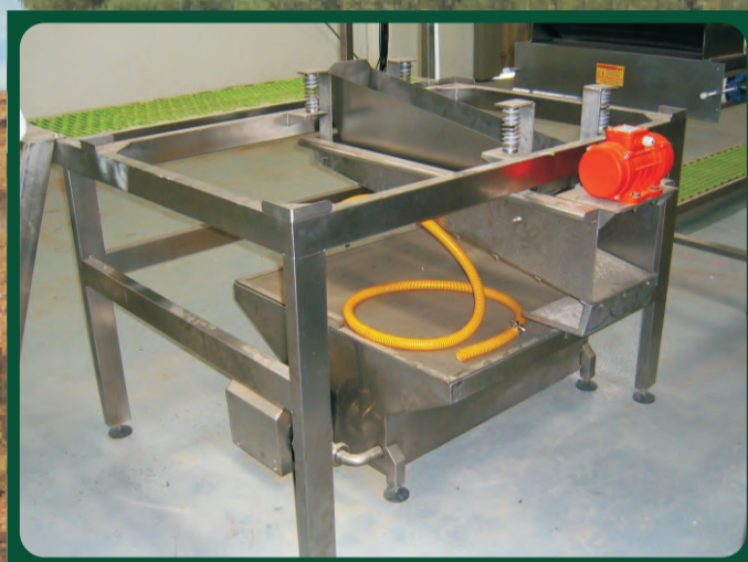
Filtros Desrrabadores Destemmer filter Destemmer filtre